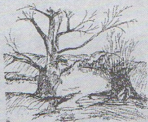
Demjén István: Tél