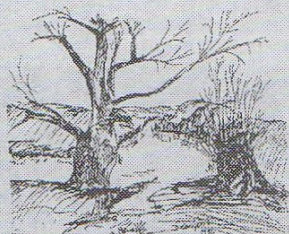
Demjén István: Tél